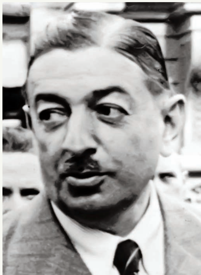
Председник Владе Драгиша Цвејковић

ји је утицао на немачку политику и мере против српског народа за време рата.