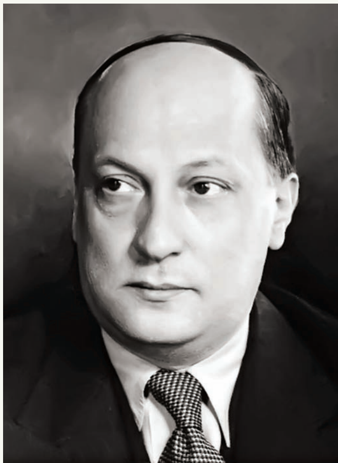
Министар иностраних послова Краљевине Југославије Александар Цинцар-Марковић

Бугарска није активно учествовала у операцијама против Југославије и Грчке да не би дала повода Турској, док је Румунији била намењена превентивна улога према СССР-у. Мађарске трупе почеле су с дејствима 10. априла 1941, после проглашења тзв. Независне Државе Хрватске. Хитлер је у говору немачком народу, 6. априла 1941. око 6 часова преко радија, осудио „војну клику“ у Београду, која је вечито организовала војне ударе и састојала се од британских „плаћеника“, извела противудар и срушила владу која је тежила миру с Немачком. Кривица је приписана оним „креатурама“ које су још 1914, Сарајевским атентатом, одвукле свет у ратну катастрофу. Чињеница да је Хитлер југословенску владу називао српском владом говори о томе колико је његова акција била уперена против Срба. Био је изричит, истичући да немачки народ нема никаквог повода да се бори против Хрвата и Словенаца, али жели да се обрачуна са оном „српском издајничком кликом у Београду која мисли да може Балкан по други пут ставити на располагање британском атентату против европског мира“. Од тада, 27. марта, па до свог краја, без обзира на нека тактичка одступања, Хитлер је задржао оштри и непомирљиви антисрпски комплекс ко-